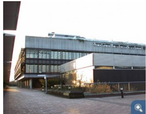
Die sanierte Unibibliothek Bremen.

Die Anfang der 1970er Jahre errichtete Staats- und Universitätsbibliothek verbrauchte enorm viel Energie, daher wurde eine gesamtenergetische Sanierung dieses Gebäudes beschlossen. Zugleich sollten Nutzbarkeit und Attraktivität für die Besucher deutlich verbessert werden. Weil das Gebäude nur wenig mit hellen Fensterbereichen ausgestattet war, sollte ein neues Beleuchtungskonzept entwickelt werden. Bauwerk, Baukonstruktion und technische Ausstattung bieten ein repräsentatives Beispiel für vollklimatisierte Gebäude der 1960er bis 1980er Jahre, deren Modernisierung in der nächsten Zeit ansteht.