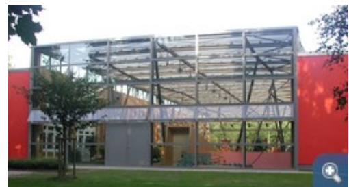
Auf der westlichen Giebelfassade wurde ein Wärmedämmverbundsystem mit Vakuuminisulationspaneelen aufgebracht © Institut für Gebäude + Energie + Licht-Planung (Igel), Wismar

Dieses Projekt zeigt die Metamorphose eines tristen Plattenbaus zu einem anregenden Lebensraum für unsere Kleinsten. Die Kindertagesstätte in Wismar musste dringend saniert werden. Mit diesem Projekt wurden Lösungen entwickelt, mit denen nicht nur energetische, sondern auch wesentliche architektonische und nutzungsbezogene Verbesserungen erreicht werden. Dazu wurde die Zone zwischen den beiden Hauptbaukörpern in Plattenbauweise komplett transparent umschlossen. Bei nur leicht vergrößerter Außenfläche wird so ein Vielfaches an nutzbarem Raum gewonnen. Der unbeheizte Zwischenbereich wirkt als thermische Pufferzone und die ihm zugewandten Bestandsfassaden können ungedämmt bleiben. Bauliche Besonderheiten bilden das transparente Foliendach über dem neuen Atrium und die großflächige Außenwanddämmung mit Vakuuminisulationspaneelen (VIP). Durch den zusätzlichen Einbau isolierverglaster Fenster in der Ebene der neuen Außendämmung konnten die im Vorfeld bereits erneuerten Fenster erhalten werden. Zum Energiekonzept gehören kontrollierte Lüftung, gezielte Beleuchtung, eine Wärmepumpe genauso wie eine Solarthermie- und eine Photovoltaik-Anlage.