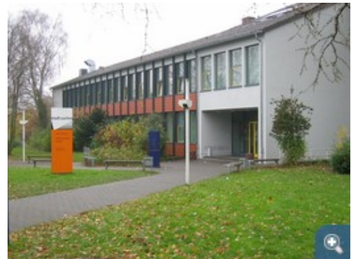
Der Eingangsbereich der sanierten Käthe-Kollwitz-Schule.

Typische Situation im Klassenzimmer: während die einen über Zugluft klagen, fordern andere mehr Frischluft. Und die Verschattung, die im Sommer vor Blendung und eindringender Wärme schützen soll, macht den Raum so dunkel, dass die Beleuchtung viel zu häufig eingeschaltet werden muss. So auch in der Käthe-Kollwitz-Schule in Aachen. Die 1951 gebaute und 1995 erweiterte Schule war in die Jahre gekommen. Eine umfassende Gebäudesanierung sollte die Unterrichtsbedingungen entscheidend verbessern und gleichzeitig die Energiekosten senken.