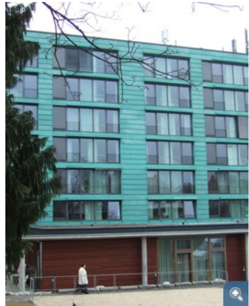
Die neue Fassade des Altenpflegeheims ins Stuttgart-Sonnenberg

Das 1965 errichtete Altenheim in Stuttgart-Sonnenberg liefert ein gutes Beispiel dafür, welche Möglichkeiten eine gleichzeitige Sanierung von Gebäude und Anlagentechnik bietet. Viele ursprünglich als Altenwohnheim konzipierte Häuser werden inzwischen vorwiegend als Pflegeheim genutzt, dadurch haben sich auch die Anforderungen an die Ausstattung verändert. Entsprechend notwendige Modernisierungsarbeiten (z. B. Einbau von Bädern in den Bewohnerzimmern) erfordern teilweise Eingriffe in die Gebäudestruktur. Werden daran energetische Sanierungsmaßnahmen gekoppelt, können gleichzeitig mit der Steigerung von Wohnkomfort und Attraktivität meist die Energiekosten stark reduziert werden.