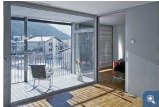
So schön kann Wohnen im Alter sein: PCM-Wärmespeicher in der Fassade eines Altersheim. Makrogekapselte Salzhydrate sind hier in das selektiv transparente Fassadenelement integriert und wirken Wärme ausgleichend ...

Bausysteme mit integrierten Phasenwechselmaterialien (PCM) können viel Wärme im Bereich der Raumtemperatur speichern. Auch ohne aktive Systeme können damit ausgestattete Räume energieeffizient temperiert werden. Mit diesem Forschungsprojekt wurden Materialien, Komponenten und Systeme auf Basis von Salzhydraten weiterentwickelt, aussichtsreiche Anwendungen identifiziert und verschiedene Systeme in Pilotprojekten realisiert und getestet. PCM-Materialien können zur Energieeffizienz von Gebäuden beitragen, indem die Spitzen der täglichen Temperaturzyklen reduziert werden. Auf eine mechanische Klimatisierung kann u. U. verzichtet werden, zumindest reduziert sich der zum Klimatisieren erforderliche Energieaufwand. Und das funktioniert so: Bei der normalen Nachtlüftung wird die Warmluft im Gebäude durch kühle Nachtluft ersetzt und auch die Temperatur der Gebäudemasse im Verlaufe der Nacht gekühlt. Mit PCM kann die Wärmekapazität eines Gebäudes erhöht und dadurch zusätzlich „Kälte“ in der Gebäudemasse gespeichert werden. Die PCM können in Wände, Decken oder z.B. in Fassadenelemente integriert werden.