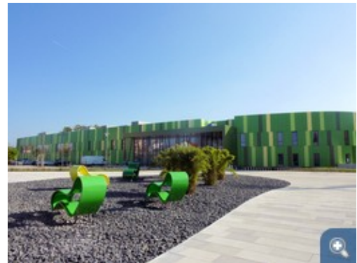
Das neue Freizeitbad in Bamberg. Zu sehen ist die Nordfassade mit der Eingangssituation. Dem Sonnenverlauf angepasst ist die Fassade von Nord-Westen bis Nord-Osten weitgehend geschlossen

Dieses neue Hallenbad ist als Erlebnisbad konzipiert, mit einem Sportbereich für die Schul- und Vereinsnutzung, sowie einer großzügigen Saunaanlage. Eine Besonderheit stellt das Warmwasseraußenbecken auf der Dachterrasse dar. Und der Neubau fällt auf durch seine energiesparende Passivhaus-Bauweise und einen bemerkenswert geringen Energiebedarf. Dies wird durch den hohen Standard der kompakten Gebäudehülle sowie durch die hocheffiziente und primärenergetisch vorteilhafte Haustechnik erreicht. Aus Gründen einer sehr luftdichten Bauweise werden auch die Rutschenattraktionen komplett in die Gebäudehülle integriert. Das Gebäude soll mit seinem Energie- und Gebäudekonzept Vorbild sein für eine neue Generation von Freizeitbädern. Deshalb soll basierend auf den Erfahrungen mit dem Betrieb dieses Schwimmbads und fundiert durch ein wissenschaftliches Monitoring ein Planungsleitfaden für zukünftige energieoptimierte Schwimmbäder erstellt werden.