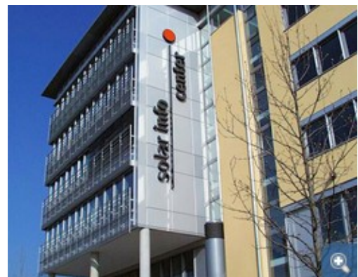
Ansicht der Westfassade

Das Solar Info Center (SIC) bietet als Investorenprojekt auf ca. 14.000 m 2 Raum für etablierte als auch junge Unternehmen mit innovativen Produkten und Serviceleistungen für die Weiterentwicklung und den wirtschaftlichen Einsatz von erneuerbaren Energien. Das Raumkonzept beinhaltet Büros, einen Tagungsbereich sowie zwei Verkaufsmärkte für Verbraucher. Das Spektrum des Dienstleistungsangebots erstreckt sich über einzelne Privatkunden bis hin zur Planung und Realisierung von gewerblichen oder öffentlichen Großprojekten. Der Energiebedarf des Gebäudes unterschreitet die Anforderungen der EnEV 2007 um 30%. Dies gelingt mit einem ausgeklügelten Gebäudekonzept und auch indem die Wärmeversorgung über Fernwärme aus dem benachbarten Heizkraftwerk der Uniklinik Freiburg erfolgt.