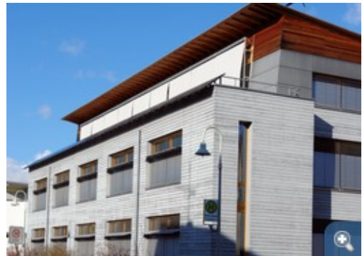
Das Bürogebäude Lamparter in Weilheim a. d. Teck wurde ohne Mehrkosten gegenüber vergleichbaren Bürogebäuden realisiert und erreicht doch extrem günstige Energiekennwerte bei hohem Komfort. Das Gebäude von Südost.

Dieses schlanke Bürogebäude zeigt eindrucksvoll, wie energetische Performance und Raumkomfort kostengünstig erreicht werden können. Der Erfolgsfaktor war hier sicherlich ein von Anfang an klar orientierter Bauherr. Das Konzept basiert auf der Passivhaus-Bauweise. Das Energiekonzept setzt auf ein Lüftungssystem mit Wärmerückgewinnung und Erdreichwärmetauscher. Geheizt und gekühlt wird ausschließlich mit Luft, nicht ganz unproblematisch für das Thema Brandschutz. Die Geschäftsführer des Ingenieur- und Vermessungsbüros Hans Lamparter GBR in Weilheim/Teck wollten für sich und ihre Mitarbeiter ein ökologisch und raumklimatisch hochwertiges Arbeitsumfeld schaffen. Dies sollte ohne Mehrkosten gegenüber einer konventionellen Bauweise erreicht werden. Das Bürogebäude wurde als integral geplantes Passiv-Bürohaus mit einem Heizenergiebedarf weniger als 15 kWh/m 2 a entwickelt. Es ist eines der ersten, kleinen Bürogebäude in Passivhaus-Bauweise in Deutschland, das sich durch eine schlanke Gebäudeenergietechnik auszeichnet.