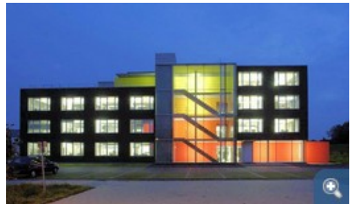
Durchaus was fürs Auge: Ansicht des BOB – Balanced Office Building bei Nacht. © Hahn Helten Architekten. Foto: Jörg Hempel

Bei dem "Balanced Office Building" gibt es eine Besonderheit: Die Planer sind auch Bauherr und Nutzer des Gebäudes. Das Gebäude konnte also in allen Details und interdisziplinär optimiert werden. Zudem war von Anfang daran gedacht, über das einzelnen Gebäude hinaus ein marktreifes 'Serienprodukt' zu entwickeln. Dementsprechend sollte das Gebäude in Erstellung und Betrieb möglichst wirtschaftlich sein. Das Konzept der Solarsiedlung veranlasste deren Planer, mit ihrem eigenen, benachbarten Büroneubau die gleichen energetischen Anforderungen zu erfüllen. Das Gebäude wurde unter Wirtschaftlichkeitsaspekten bewertet und optimiert. Mit seinem großflächigen Grundriss ohne tragende Innenwände ermöglicht das Gebäude eine variable Unterteilung in Nutzungseinheiten und verschiedene Büroformen. Außerdem bemerkenswert: Das Gebäude hat nur einen Stromanschluss und setzt dabei auf die über Erdsonden gespeiste Betonkerntemperierung in Kombination mit Wärmepumpe.