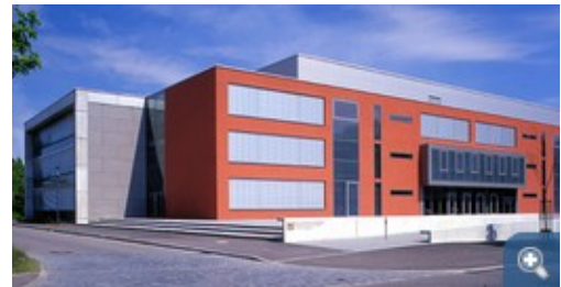
Die Berufsschule in Biberach bei Tag von der Leipzigstraße aus gesehen.

Die Gebhard-Müller-Schule ist eine kaufmännische Schule im Kreis-Berufsschulzentrum Biberach. Mit diesem Neubau erhielt die Schule ein eigenes Gebäude, das sich an den sehr ambitionierten Vorgaben des Bauherrn in Bezug auf Komfort, Flexibilität der Räumlichkeiten und Energieverbrauch orientiert. Bestandteil des Bauvorhabens ist ein innovatives Energiekonzept mit einem geringen Heizwärmebedarf auf „3-Liter-Haus“-Niveau. Das Gebäude nutzt in erster Linie thermoaktive Bauteilsysteme (TABS) zur Heizung und Kühlung.